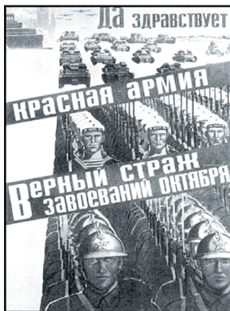
Viva o Exército Vermelho: verdadeiro guardião das conquistas de Outubro