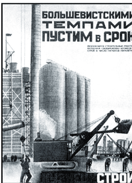
Construção de Kuznetsk: em ritmo bolchevique, por K. Vialov, 1931