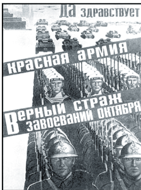
Viva o Exército Vermelho: verdadeiro guardião das conquistas de Outubro