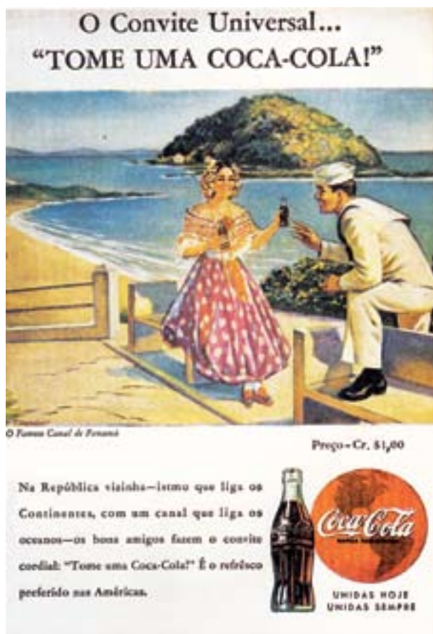
WANDER MELO MIRANDA (org.) Narrativas da modernidade . Belo Horizonte: Autêntica, 1999.

A caricatura acima, de 1904, e o cartaz publicitário da Coca-Cola, de 1944, apontam para contextos diferenciados das relações do governo dos EUA com países da América Latina.