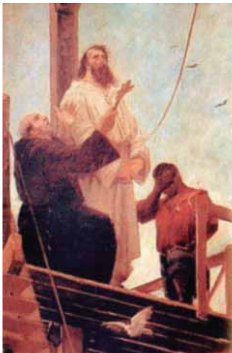
Tela de Francisco Aurélio de Figueiredo e Melo (1893).