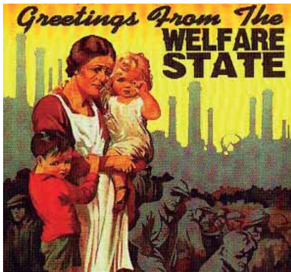
Cartaz divulgando os benefícios concedidos pelo Estado inglês. Nele lê-se: "Saudações do Estado do Bem-estar Social".

Operários da siderúrgica ArcelorMittal protestam, em Marselha, contra plano do governo de Nicolas Sarkozy de aumentar a idade mínima de aposentadoria para 62 anos. Desde que a degradação da economia grega chamou atenção para os déficits explosivos europeus, os governos do continente se sucedem em anúncios de medidas de austeridade. Na Grécia, cortam-se salários e aposentadorias, aumentam-se impostos, e o resultado é uma economia de 30 bilhões de euros. A Espanha adiantou-se ao perigo e decidiu fazer cortes de 65 bilhões. Principal economia do continente, a Alemanha de Angela Merkel promete cortar 80 bilhões de euros até 2014.