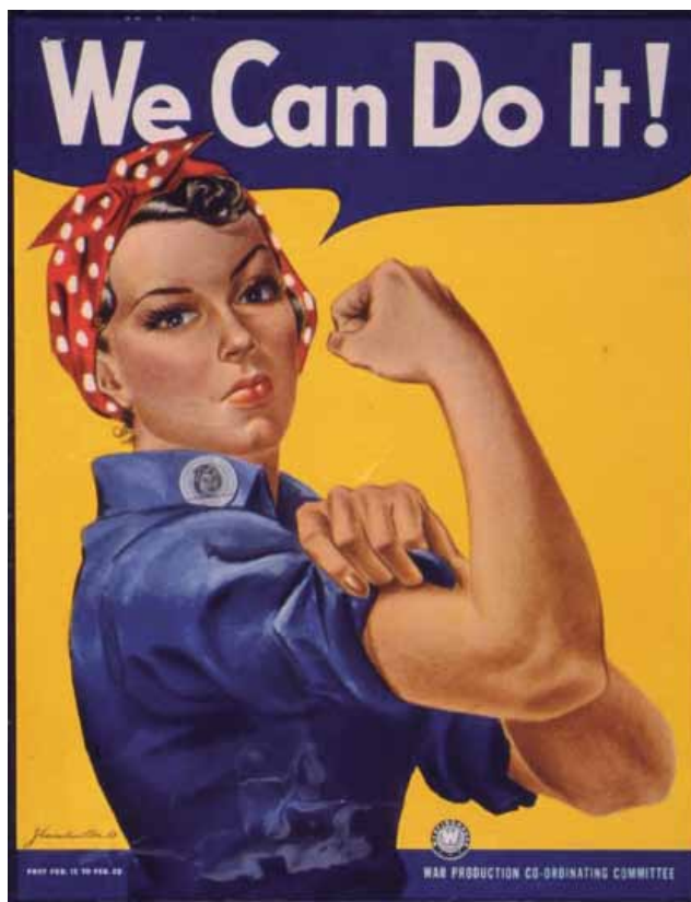
Cartaz de propaganda da Westinghouse (E.U.A., 1942-1943), em que uma operária diz: “Nós podemos fazer isso!”.