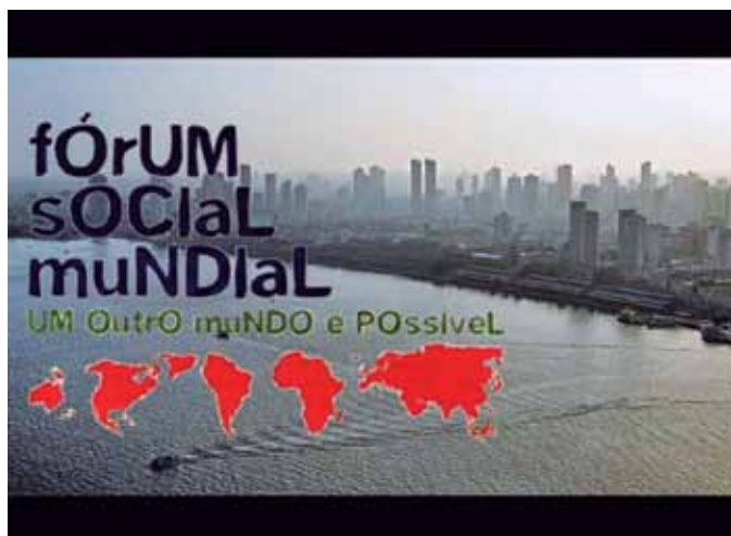
Cartaz do Fórum Social Mundial realizado na cidade de Belém do Pará, em 2009.